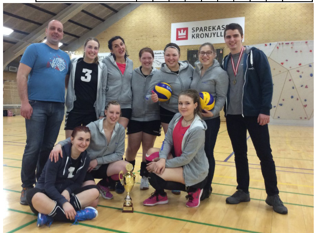
TSTs vindere af JSD