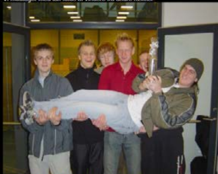
Lemvig GF, Vestjysk Mester i HY

Herunder findes billeder af nogle af rækkevindere. Vi modtager med tak fotos af vindere fra andre rækker